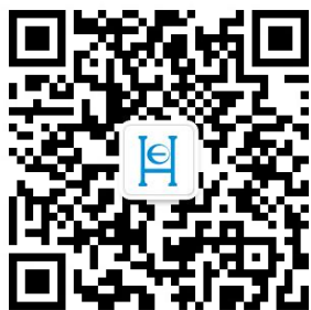
启行公众号二维码